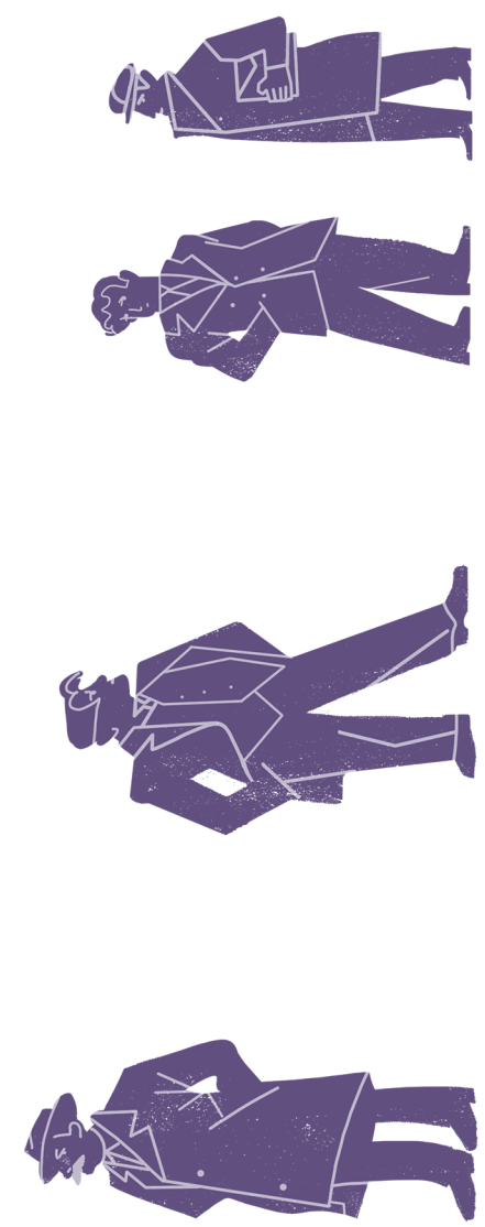
Михаил Зощенко 167 см Сергей Есенин 168 см Владимир Маяковский 189 см Максим Горький 193 см

А какой у тебя рост? Измерь свой рост и рост своего спутника. «Впишите» себя в ряд с писателями по росту.